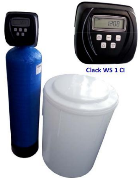
Clack WS 1 CI